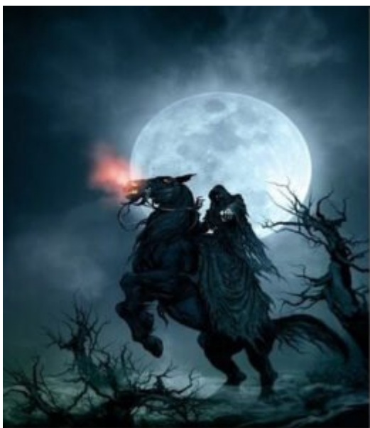
Ponto cantado de chamada

Os Exús citados acima comanda diversas legiões de espíritos, sob o comando do Exu Rei das Sete Encruzilhadas, neste reino das encruzilhadas ainda temos a Pomba Gira Rainha das Sete Encruzilhadas.