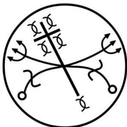
Imagem do livro Quimbanda O Culto da Chama Vermelha e Preta de Danilo Coppini.

Por ser de alta evolução espiritual, esta Rainha possui uma enorme sabedoria, porém, nem sempre compartilha por ser muito criteriosa, desprezando as pessoas que lhe procura por motivos fúteis e sem seriedade. Muitos sentem desconfortáveis ao olhar para alguém manifestado por uma Pomba Gira das Almas, pois ela penetra na mente com extrema facilidade e não é atoa que pode reverter situações de vícios, ajudando no equilíbrio mental e físico. Sua energia pode conceder desapego material e ajudar a evoluir.