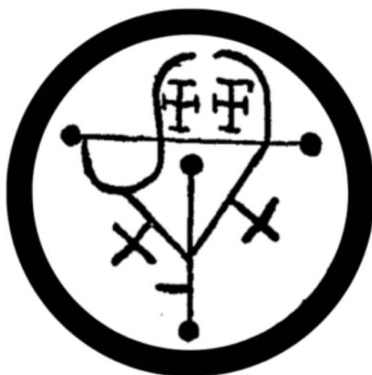
Imagem extraída do livro – No Reino dos Exus.

Exu morcego é uma entidade dos ventos, mas sua principal área de atuação é nos cemitérios e nas Kalungas.